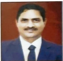
Dr. Babu Sitaram Khaire Anandrao Dhonde Alias Babaji Mahavidyalaya Kada